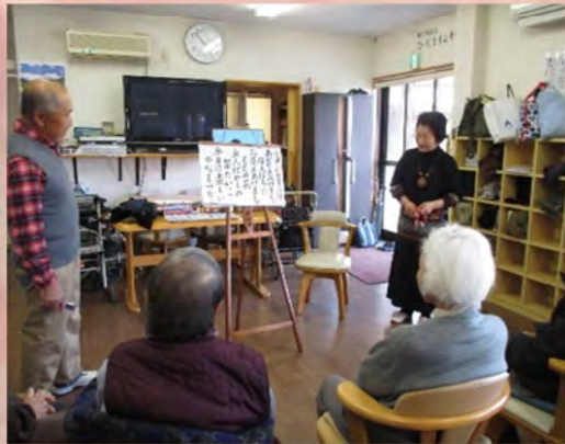
ハーモニカ演奏に昔を思い出されました。