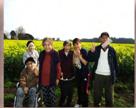
西都原 菜の花見学(〜〜)綺麗でした。