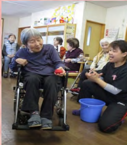
グループホームと楽しい交流会になりました。