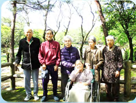
先月も個々の目的に応じて沢山お出かけして来ました