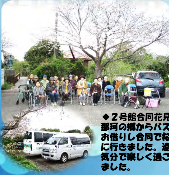
◆2号館合同花見◆ 那珂の郷からバスをお借りし合同で桜見に行きました。満足気分楽しく過ごしました。