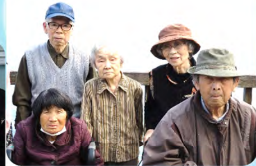
◆日南海岸へのドライブ◆