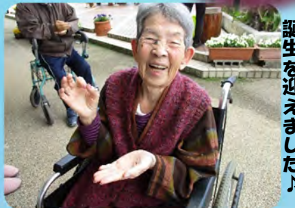
千ドリさん九八歳の誕生日を迎えました♪