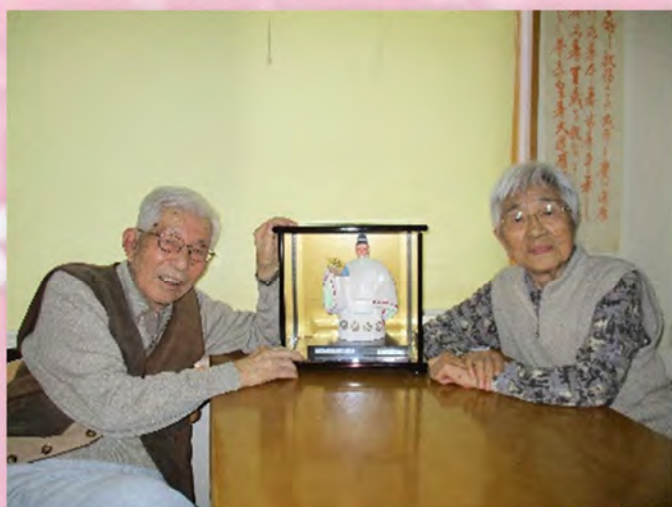
ひだまり2号館の3月ベストショット