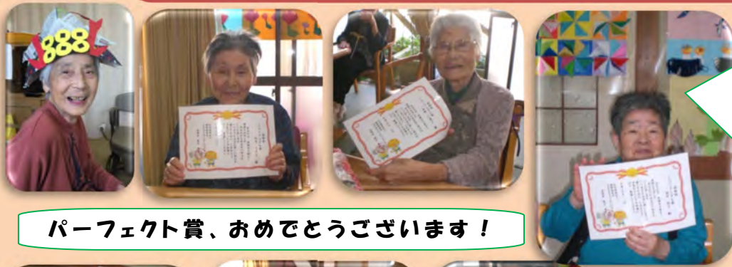
パーフェクト賞、おめでとうございます！

貯筋通帳、皆さんつけていますか〜？第2回の表彰式です。次は5月末で集計しますので付け忘れないか確認されて下さいね☆