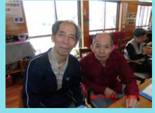
友達と楽しい時間