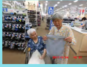
外出・外食(お買い物)