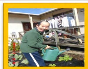
おいしい野菜が食べられますように!!