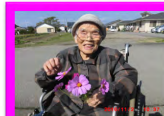
園内のコスモスをとってお部屋に飾りました。