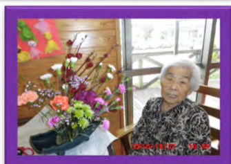
玄関に飾っています。見に来てくださいネ