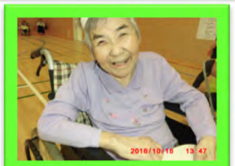
運動会ではたくさんの笑顔がありました。