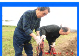
たくさんのお芋が収穫できました。(頑張りました。)