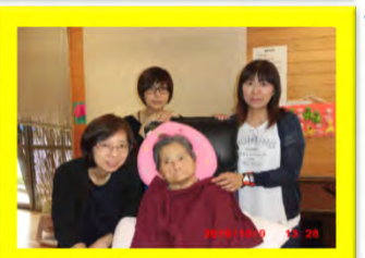
家族で記念撮影みんなの優しさが嬉しいです。