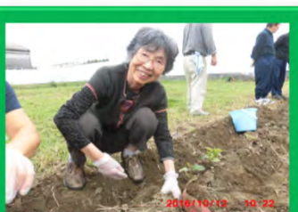
お芋の成長に驚きや感動がありました。収穫したお芋は料理に使います。