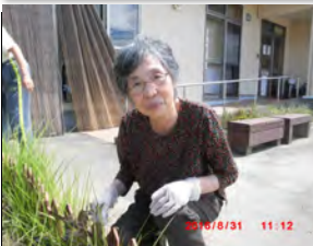
日課として草むしりを頑張ります。