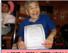
お部屋の掃除を頑張りました。