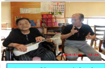
ウクレレを弾きながら音楽に合わせて手拍子