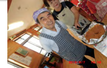
調理は一緒に作る事が醍醐味です