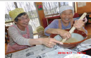
仲良く調理を楽しんでいます。