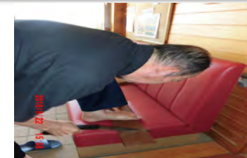
日曜大工(今月は何か出来るかな?)