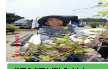
外での交流を楽しみました