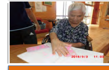
文化作品も頑張って作っています。