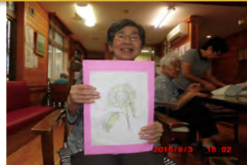
心の中にもたくさんのヒマワリが咲いています。