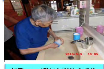
毎日、コップ洗いありがとうございます。