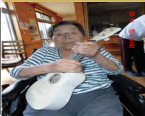
昔は三味線！今はウクレレを楽しんでいます。