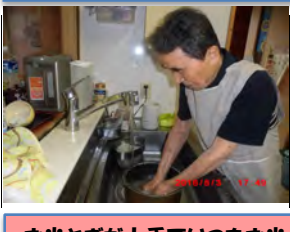
お米ときが上手でいつもお米が美味しいです。