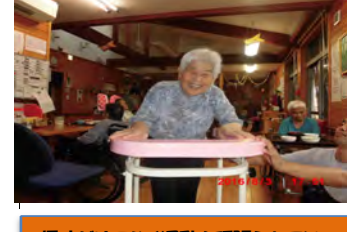
趣味だけでなく運動も頑張られています。