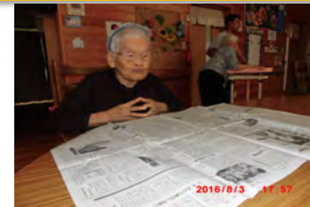
新聞を読む事が毎日の日課です。今日は何のニュース？