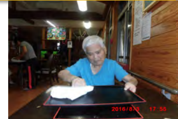
食事の後のお盆拭きを頑張っています。