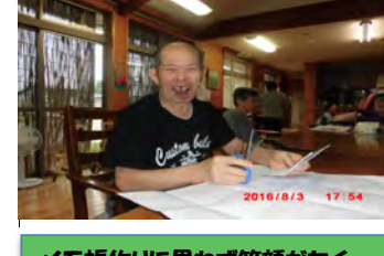
メモ帳作りに思わず笑顔がたくさんありました。