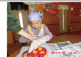
お誕生日ケーキを頑張っていました。