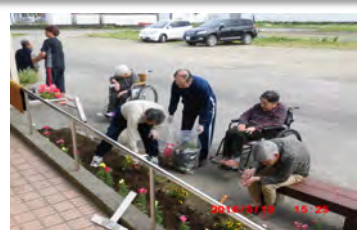
花壇の花上を皆さんで行いました。