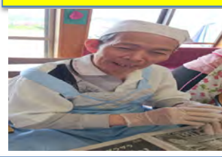
お団子作りでは大活躍しましたネ