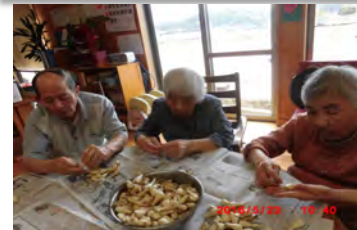
らっきょの皮むきもうそんな時期ですネ