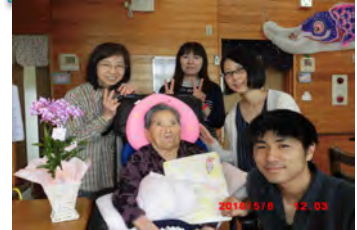
母の日に家族に囲まれて記念撮影