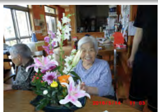
毎月の楽しみ!!玄間に展示していますので見に来てください