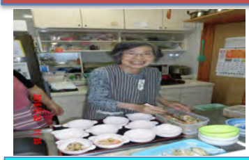
台所のお手伝いありがとうございます。