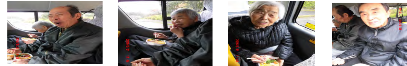
お花見お弁当～ご家族と一緒に西都原古墳群に桜を見物して手作りお弁当を予定していましたがあいにくの雨天になり本当に残念でした。けれど、朝から皆さんで作ったお弁当を持って、車の中からお花見を楽しみました。まだ、満開では無かったけれども咲いている桜を見て春の訪れをたくさん感じました。これからもたくさんの春を見つけに行きましょう。