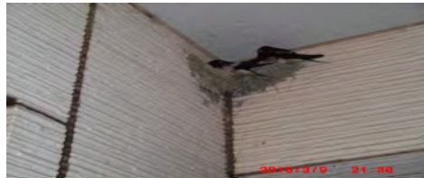
今年もグループホームにツバメがやってきました。