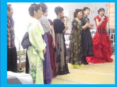
誕生会ではボランティアさんが素敵な出し物で盛り上げて下さりました。皆さんおめでとうございます☆