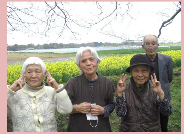
西都原に桜を見に行きました❁桜の薄ピンクと菜の花の鮮やかな黄色がとても素晴らしいコントラストでした。みなさん、桜の下へ行き、見とれていました(*。*)自然と笑顔になり、明照デイも桜に負けなくらい満開の花が咲きました♪♪