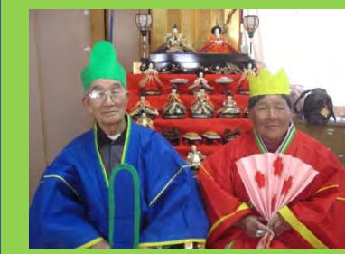
ひな祭り写真会♪おやつは甘酒と手作り菱餅ととっても豪華でした！