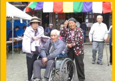
毎年恒例の鬼子母神祭。今年も行ってきました。昔を懐かしんでおられました(〃)