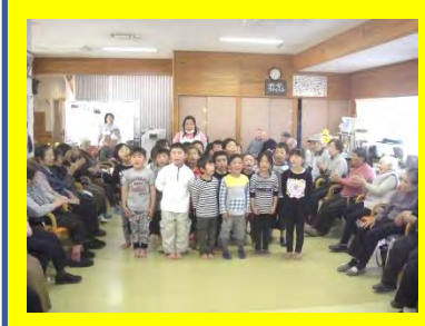
明照保育園とのお別れ会。ついこの間まで抱っこをされていたみんなもたくましく成長しました。誕生会でもいつも踊りや歌を見せてくれました。ご卒園おめでとうございます☆☆